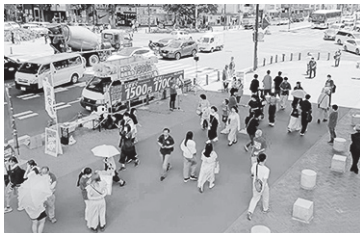
多くの人にアピール

愛労連は5月18日11時から、最低賃金全国一律いまして1500円、めざせ1700円を掲げて「最賃ビッグアクション」を、初めて矢場町交差点にておこなわれました。若者など人通りの多い時間帯で、署名56筆、シールアンケート156人分が集まりました。アンケートでは、時給1500円