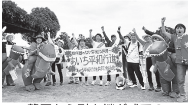
静岡から引き継ぎ式での県内通し行進者のみなさん

2024年の平和行進が5月31日、愛知県入り。今年、来年の被爆80年に向けての運動、非核日本キャンペーン愛知版「プロジェクト80th被爆者とともに核なき世界を見よう」をめざすス