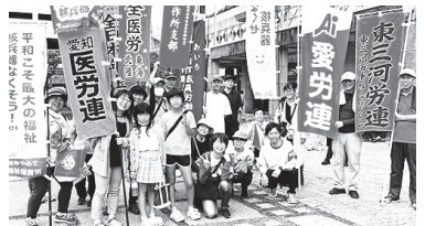
豊橋コース・労働組合の仲間も多数参加

31日のゴール地、桜丘高校で、今年も歓迎集会が開かれました。行進での「原爆の火」は桜丘高校から分火されています。生徒会長の平和への思い、和太鼓部による力強い演奏に、行進参加者は元気をもらいました。