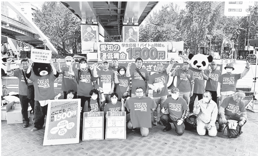
真っ赤な最賃¥1500 Tシャツで矢場町交差点にて元気に宣伝