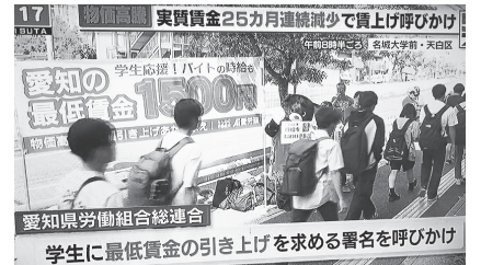
名城大学前朝宣伝テレビ愛知で報道