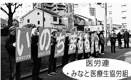
医労連 ・みなと医療生協労組