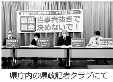
県庁内の県政記者クラブにて

非正規・女性の声を最賃審議会へ 最賃1500円の実現に向けて、愛労連は今年改選になる最賃審議会について、労働者委員に5名を推薦しました。最賃の影響を強く受ける非正規労働者と女性の意見を反映させることを重視し、非正規労働者は3人、女性は4人推薦し(下記参照)、3月24日には記者会見をおこないました。(写真⑤)