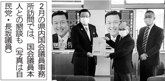
2月の県内国会議員事務所訪問では、国会議員本人との懇談も(写真は自民党・長坂議員)

非正規・女性の声を最賃審議会へ 最賃1500円の実現に向けて、愛労連は今年改選になる最賃審議会について、労働者委員に5名を推薦しました。最賃の影響を強く受ける非正規労働者と女性の意見を反映させることを重視し、非正規労働者は3人、女性は4人推薦し(下記参照)、3月24日には記者会見をおこないました。(写真⑤)