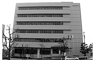
三重県労委に申請中

労働契約法18条に基づく無期労働契約に転換されていた労働者のクビを「違法ともいえずに」一切の方法。鈴鹿大学の事業は、それを「ビジネス法務」が地で実践するものです。