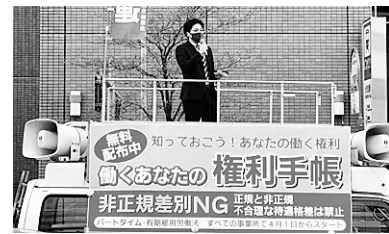
4月1日、フレッシューズ宣伝

「パートタイム・有期雇用労働法」には、非正規労働者の不合理な待遇格差を是正することを目的に、「同一労働同一賃金ガイドライン」によって、より具体的に「不合理な待遇の格差」が例示されています。 賞与や諸手当など「ひとつひとつの待遇ごと」にその待遇の「性質・目的」に照らして不合理な格差を禁止しており、なぜ非正規の待遇が違うのかその理由を説明することが事業主の義務とされ、合理的な説明が