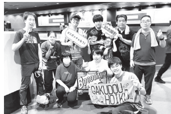
もっと多くの交流を サマーセミナーで