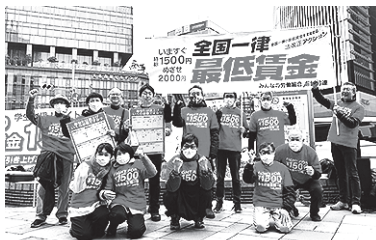
いますぐ1500円めざせ2000円

愛労連は、2月1日、全国最賃デー・ローカルビッグアクション名古屋駅宣伝にとりくみましました。19人が参加し、週末で賑わう名古屋駅前1000枚のチラシを配布し、元気にアピールしました。