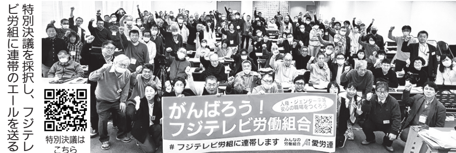
特別決議を採択し、フジテレビ労組に連帯のメールを送る

「実際の交渉で早速試したい」「ストライキの使い方が重要と分かった」など役立つ学びになったと好評でした。 【全国一般】ナトコ労組では、幅広い意見を集めるためにみんなの要求アンケートを実施し、職場全体から声を集め、中間結果をニュースで伝え、さらなるアンケートの協力をよびかけています。「会社への意見を聞いてもらえる機会があって非常に嬉しい。もっと意見を吸い上げてほしい」と声が寄せられています。