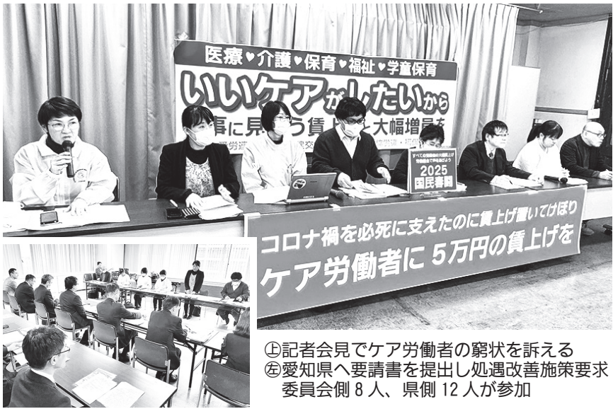
①記者会見でケア労働者の窮状を訴える ②愛知県へ要請書を提出し処遇改善施策要求委員会側8人、県側12人が参加

比べ極めて低い賃金であり、5万円の処遇改善に向け県独自の人材定着・確保につながる施策を」と訴えました。 記者会見では、25春闘みんなの要求アンケートの結果を発表し、生活が苦しい実態を各組合から報告しました。 各組合では、春闘の要