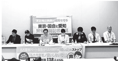
オンラインで2カ所を結び同時記者会見 ④記者会見名古屋会場（写真の一部を加工しています）⑤記者会見東京会場