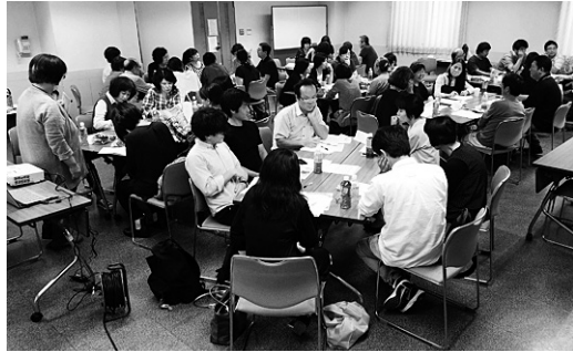
コープあいち労組では非正規労働者の要求を組合員が集まり真剣に話し合う