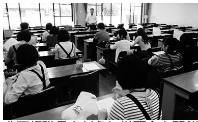
非正規職員を対象に学習会を開催 (豊橋市職労)

10月から12月末までを期間とする、秋の組織拡大月間がスタートしました。 愛労連は、これに先立つ9月29日に秋の組織拡大月間の成功をめざす単産代表者会議を開催し、月間方針の意思統一と同時に各単産の目標や計画、とりくみについて交流しました。 愛労連は、1年間で5000人拡大することを目標に、この秋の月間では、10月採用など年度途中採用者の100%加入や、職場の非正規労働者、未加入者への働きかけをすべての職場でとりくむよう提起してい