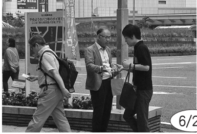
東海労働弁護団や名古屋ふれあいユニオン、健康センターなどと働き方改革一括法案の問題点を訴えて宣伝した