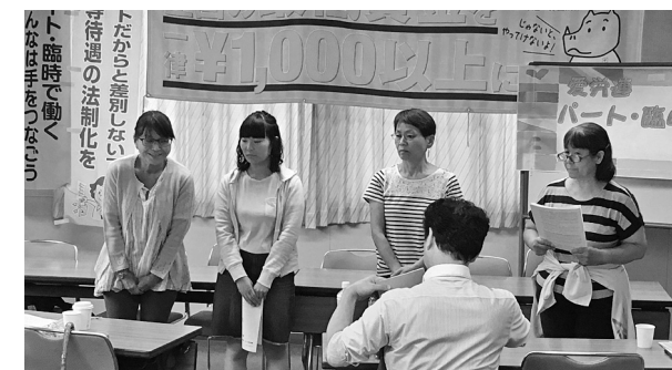
新役員になった皆さんの紹介

「保育労働実態調査結果」の概要について特別報告がおこなわれた後、17年度の活動報告と18年度の方針提案へ。討論では5単産からそれぞれ職場の実態が報告されました。最後に幹事会から、「非正規自身が主体になる運動を作っていくこと、学習を中心とした活動も頑張ろう」とまとめの発言があり、すべての議案が採択されました。