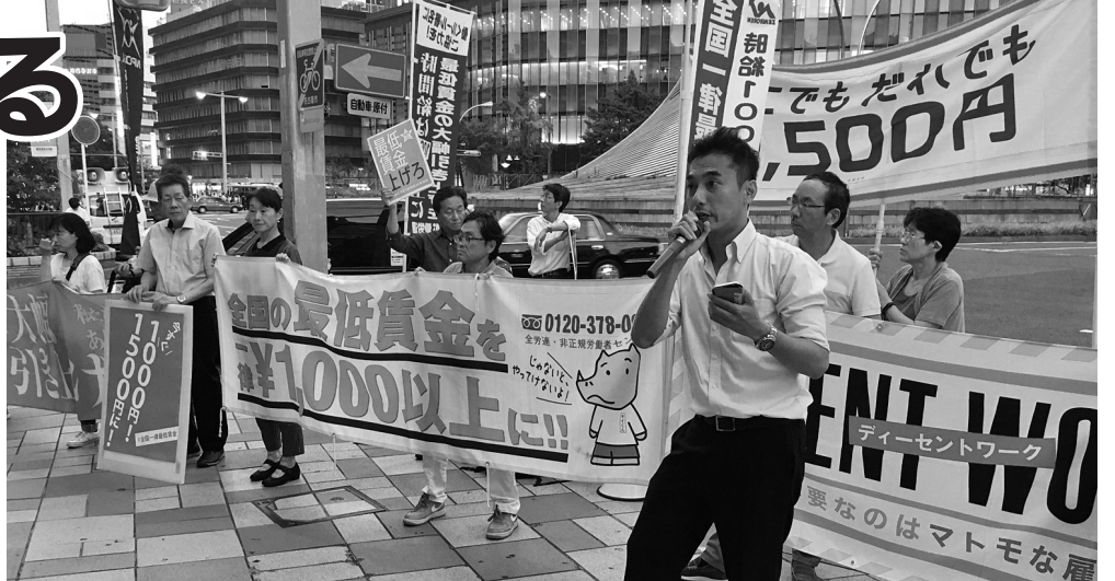
最低賃金は「今すぐ1,000円、1,500円に!」と訴える参加者 (6月27日、名古屋駅)