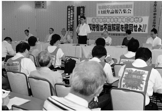
報告集会で説明をする弁護団

7月5日、名古屋高等裁判所（揖斐潔裁判長）は、2名の原告が社会保険庁による分限免職処分（整理解雇）の取り消しを求めた裁判の控訴審に対し、控訴棄 却の判決を言い渡ししました。昨年3月に名古屋地裁が出した請求棄却に続く不当判決です。 この裁判は、2009年12月31日の社会保険庁解体に伴って強行された525人にも及ぶ大量解雇の取り消しを求めたもので、愛知では愛知国公傘下の全厚生労働組合の組合員2人が提訴してたたかっていました。 国家公務員法による分限免職処分は、処分を受ける職員には