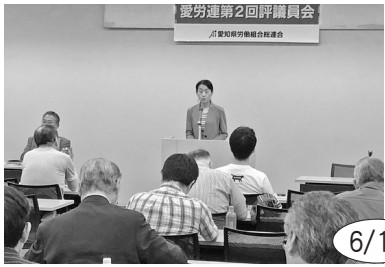
愛労連評議員会を開催し「労働者・国民の生活を守り要求実現のたたかいをめざす夏期闘争方針」を確認した

非正規労働者については、正規職員では当然整備されている病気休暇や福利厚生等が十分でなく、一時金や退職金などの賃金体系整備がすすんでいません。全体的な労働条件の底上げが不可欠な課題であり、