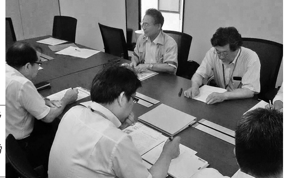
2018年度最賃生活体験者収支決算平均値との比較表