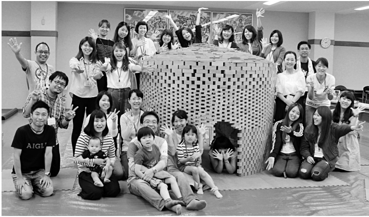
福保労主催のワークショップで積木のドームと一緒に①、建交労学童保育支部の新任向け学習会②