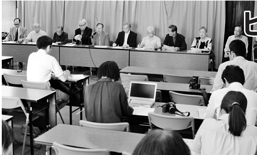
ヒバクシャ国際署名を進める愛知県民の会の記者会見(6月9日、愛知県庁)

■と き 7月23日(日) 9時30分開場 10時開会 ■ところ iビル7階(シビックホール) JR「尾張一宮」/名鉄「名鉄一宮」駅 ※お弁当1000円(要・事前申し込み)