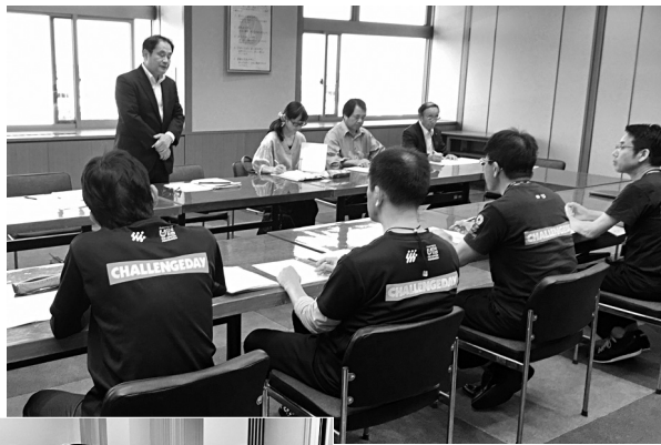
公契約条例を制定した碧南市④、昨年のキャラバンの資料を参考にチェックシートを始めると話した阿久比市⑤

加しました。31日には、第一交通の無法を改めさせるため、衆参両院の厚生労働委員70名への議員要請を行いました。