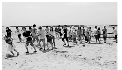
網をいっせいに「よいしょ」

遊びと交流を満喫 今年新たに最低賃金についての学習コーナーが設けられました。現在の最賃額と今年の予想最賃額についてのシールアンケート、青年協のこれまでの最賃に関する活動の紹介などがおこなわれ、今後の最賃のとりくみへの協力も呼びかけられました。 地引き網体験や遊びを通して