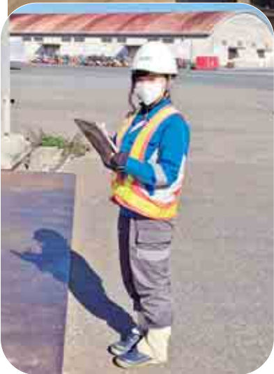
女性検数員もがんばってます

愛知県は、世界的なものづくり産業の集積地であり、物流面で支える国内有数の国際総合港湾が名古屋港です。そこで働く検数労働者を紹介します。