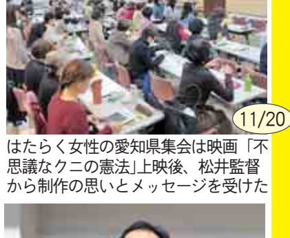
11/20 はたらく女性の愛知県集会は映画「不思議なクニの憲法」上映後、松井監督から制作の思いとメッセージを受けた。