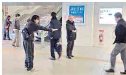
地域総行動では「組合に入ろう」と書かれたチラシを配布 (11月17日・緑地域センター)