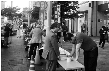
憲法と平和を守る宣伝(10/29)

最後、戦後レジームからの脱却として「憲法改正、教育改革、メディア規制」を狙う安倍政権に対し、「メディアは声を上げ