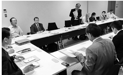
自治体キャラバンで阿久比市と懇談。移行される介護の総合事業に質問が相次ぐ。(10/27)