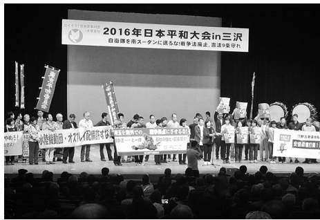
安保法制(戦争法)廃止! 9条守れと全国から集まった大会の開会集会