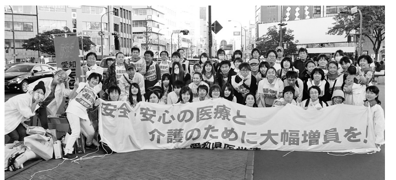
全県労働者決起集会最後に団結ガンパロウで意思統一①、ドクター・ナース・介護ウェブに参加した仲間たち②