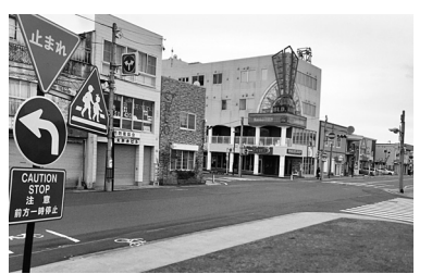
人がまばらのアメリカ村

基地正面ゲート前にはアメリカ村(アメリカ人は立ち寄らない)という小綺麗な商店街が基地にともなう助成金でつくられています。が閑散とした風景です。青森県は米軍や自衛隊の基地が沖繩に次いで多く、また原発廃棄物の貯蔵施設もあり、いざ戦争となると沖繩と一緒に攻撃される地域といわれています。