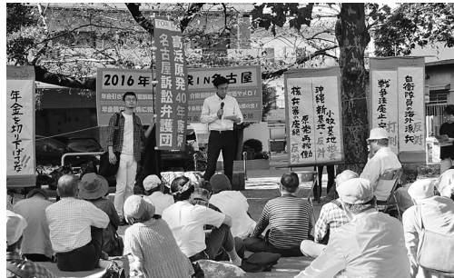
年金改悪は全ての世代の問題。「年金一揆」で年金者組合のほか、様々な団体が発言。(10/15)