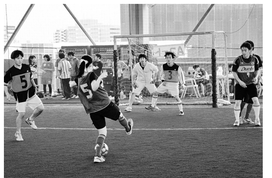
名水労で年に3回おこなわれる大人気のフットサル大会の白熱した様子