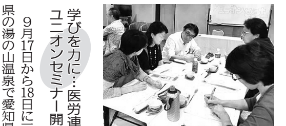
グループ討論のようす

也書記長からは組織強化について語られました。「将来の担い手は若い仲間。なぜ組合に入ってくれているのかを考えるべき」として毎年、150人以上が参加するフットサル大会やスノーシューなど、若年層組合員の要求を捉えたとりくみを継続し、成功させています。