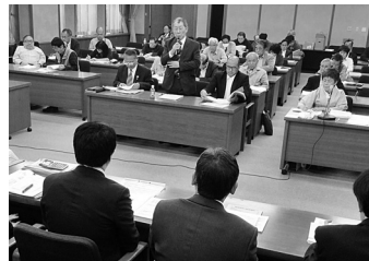
昨年の名古屋市要請の様子

毎年秋におこなっている愛知自治体キャラバンとは、県内のすべての自治体を訪問し、各市町村に対し、医療・福祉・介護など社会保障の拡充と、国や愛知県に意見書の提出を求めようとするもので、今年37回目をむかえます。この間の要請で、「福祉給付金」については08年に全県で現物給付に変更し、立替払いが不要となりました。他にも中学校卒業までの医療費無料制度は昨年で85%の自治体に広がるなど、国や愛知県の制度を大きく変化させています。