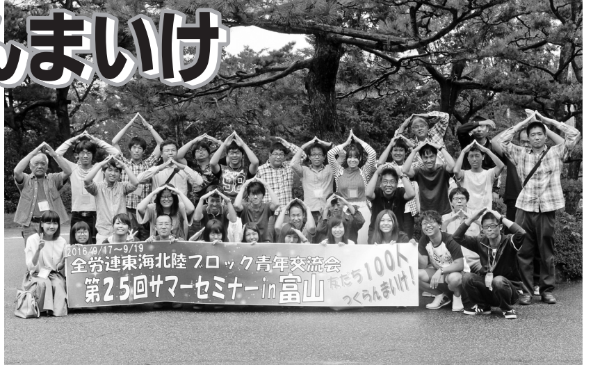
サマーセミナー参加者でホテルイカのポーズ(9月19日、富山)

秋の組織拡大月間が10月から始まりました。それぞれの職場でとりくむがすすむなか、しゃべり場づくりや組織強化のために「わくわく講座」を活用した学習交流、若者企画など様々に展開されています。