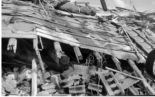
屋根が崩れ落ち全壊した家屋

9月19日(月祝)から28日(水)まで、熊本地震・労働相談ホットラインの相談員として熊本県労連へ行ってきました。これは熊本被災者支援のために全労連が呼びかけたものです。労働相談自体は、熊本県の労働局が当初から迅速に対応していることもあり、1日に1件あるかどうかで、相談内容も震災には直接関係のないものでした。23日の午後、熊本熊本県