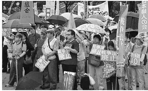
自治労連愛知非正規公共評がおこなった「社会保障適用拡大」学習会①と9.19集会②