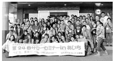
昨年のサマーセミナー参加者