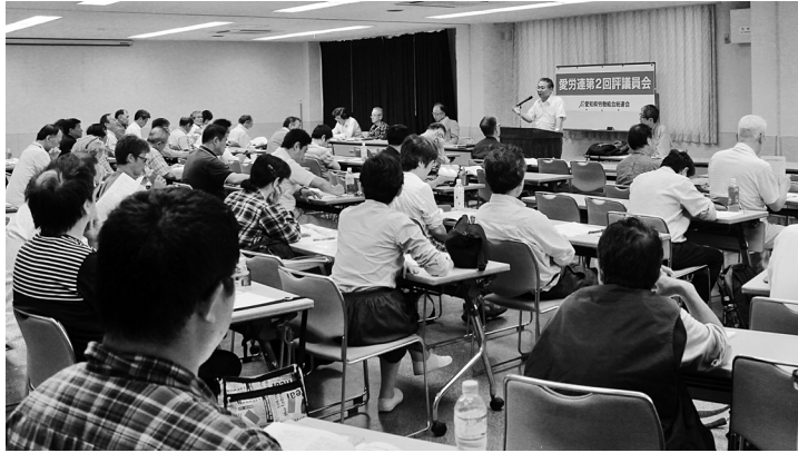
冒頭にあいさつをする樽松議長