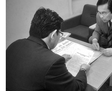
会派まわりをする地区労連の役員

一宮地区労連では、2014年から一宮市議会に最低賃金改善の意見書採択を要請する行動にとりくんでいます。1年目は各労働組合の単組や地域の民主団体からも団体署名に協力してもらいましたが、否決されました。2年目も3月議会で否決。その理由が「最賃を上げた中小企業は経営が成り立たない」ということでした。