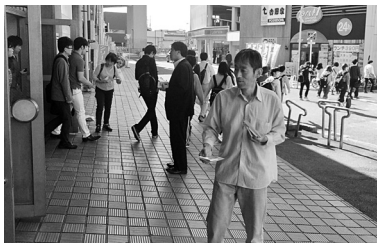
堀田駅で瑞穂区労連が配布