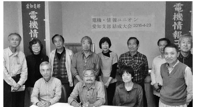
結成大会に参加したみなさん

裁判をたたかってきた組合員から「三菱電機の社長に謝ってほしい」とたかいたを続けてきた。電機・情報ユニオン愛知支部結成を力にして解決したい」と決意が述べられました。