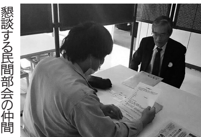
懇談する民間部会の仲間

愛労連では、傘下の職場でこの春に1619人が採用されましたが、新人全員加入と合わせて職場の未加入者への働きかけなどで2000人の拡大を掲げてと取り組んでいます。4月7日