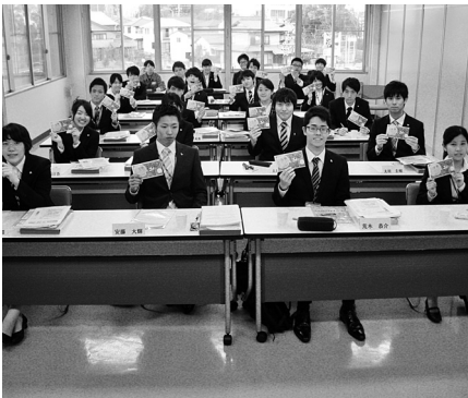
新人さん24人が全員加入 (生協労連・コープあいち労組)

愛労連では、傘下の職場でこの春に1619人が採用されましたが、新人全員加入と合わせて職場の未加入者への働きかけなどで2000人の拡大を掲げてと取り組んでいます。4月7日