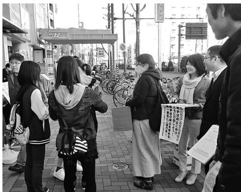
若者と対話する青年ネットの仲間

3月21日、中区の大須万松寺で愛労連青年協も参加する青年ネットAICHIによる「戦争法廃止を求める統一署名」行動を行いました。青年ネットAICHIは、平和や民主主義、経済転換など3つの共同目標に賛同した団体や個人の集まる若者のネットワークであり、04年の立ち上げから愛労連青年協も関わっています。発足時から青年協議長は共同代