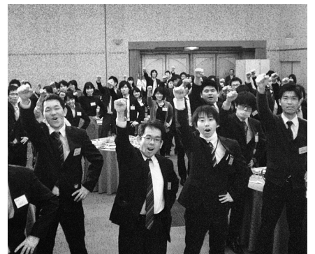
歓迎パーティで団結ガンパロー (自治労連・岩倉市職)

自治労連では4月1日から新人100%加入にむけ猛ダッシュ。全県で昨年を上回る591人(38.8%)が加入しています。長久手市職労の説明会は、19人の新人に25人の先輩が駆けつけ、準備したケーキを食べながら柔らかい雰囲気の中で行われ、信頼できる先輩からのよびかけに全員が加入。ほにも中水労や春日井給食会労組でも100%加入を実現しています。