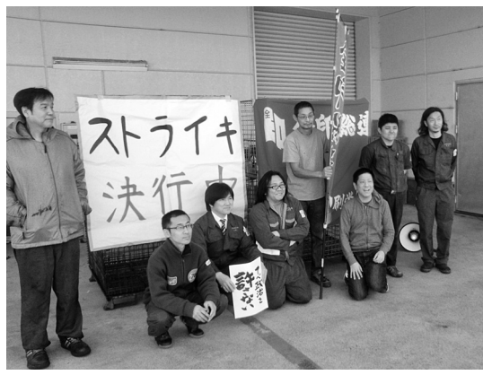
JMITU川本製作所のスト集会①、JMITU通信労組愛知支部のストライキ②、3/22におこなった全印総連中部共同印刷労組の時限スト③