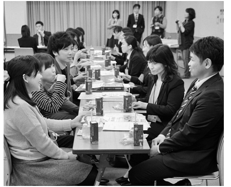
説明会で先輩と懇談するようす (自治労連・長久手市職労)

新年度に入り多くの職場で新規採用者を迎えています。すべての新人に労働組合の大切さを伝え100%加入をめざしたとりくみが続いています。長久手・中水労・春日井給食で全員加入