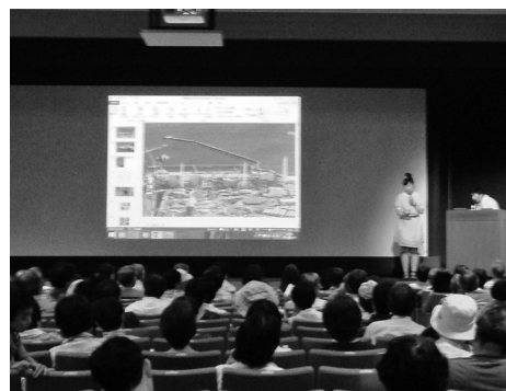
福島の実態を映像で紹介

東日本大震災から50ヵ月。福島の今、講演とトークライブが6月14日に名古屋市鯉城ホールで開催されました。