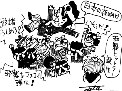
戦争の夜明けでしょう。高木 徹

安倍が安保か? なんだんねんや それではないか。それではないか 戦争いっしょ バカボン オールイスマン 自民党 ※ 天バカボンの替え歌です。