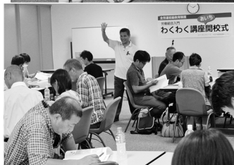
愛知の受講生は99人にまで広がりました（6月27日現在）。医労連の29人を筆頭に福保労や全国一般、国公などが多数で受講しています。

6月27日、刈谷市産業振興センターで全労連初級教育制度「わくわく講座あいち開講式」が開かれ、ベテランから組合初心者という青年まで幅広い層から34人の受講生が参加しました。