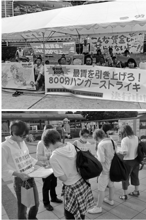
800分ハンガーストライキ行動で座り込む参加者（6月19日、栄、写真①）、「最賃引き上げと労働法制改悪反対緊急宣伝」（6月24日、金山、写真②）

6月19日、第3次愛知最賃デーとして800分のハンガーストライキ行動（深夜0時から13時20分まで）にとりくみました。