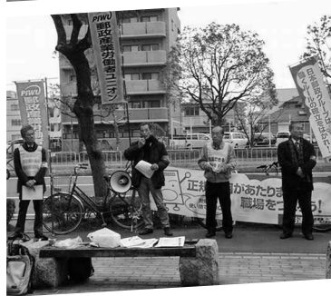
JMIU文化シヤッター名古屋支部ストライキ①(3月5日)、医労連名南会労組ストライキ(3月12日)、郵政産業ユニオンストライキ(3月16日)