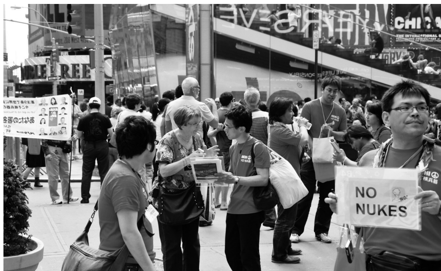
タイムスクエア前で署名にとりくむ愛知の代表(2010年N・Y行動にて)