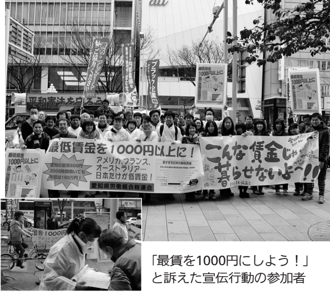
「最賃を1000円にしよう!」と訴えた宣伝行動の参加者

3月15日(日)、第一次愛知最賃デーとして買い物客で賑わう栄・丸栄スカイル前で1時間宣伝しました。