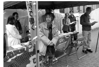
パ臨連と千種名東労連の仲間

では生活できません。1000円に引き上げましょう」と呼びかけました。隣では年金署名や九条署名もとりくまれており、若い夫婦からお年寄りまで様々な年代の方から30分の間に30筆が集まりました。