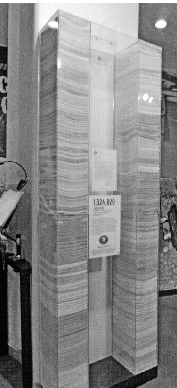
国連総会議場入口に設置されている「核廃絶」を求める署名