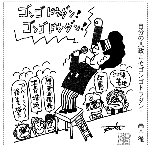
自分の悪政こそゴンドウダン！ 高木 徹