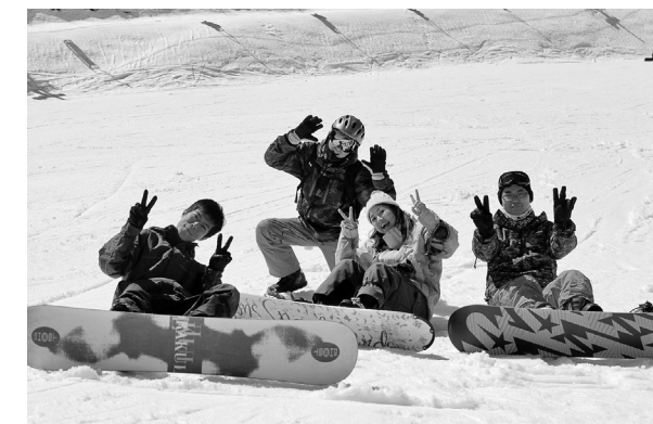
スノボを楽しむ参加者 (2014年3月15日)

第3回目を迎える冬ツアーが今年も3月21～22日にかけておこなわれます。昨年からスタートした15年度青年協メンバーの第1弾の企画です。今年度もこれまでのつながりを大切に、これらを発展させ、仕事や私生活でも活用できるつながりを作れるしなやかさを考え、様々な企画をおこなっていきま