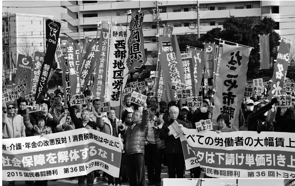
決起集会に集まった参加者①、本社前でデモ行進する様子② (ともに2月11日)、トヨタ本社への要請団③ (2月6日)

■とき 3月15日(日) 13時～イベント 14時～集会・デモ ■ところ 白川公園 (名古屋市中区)