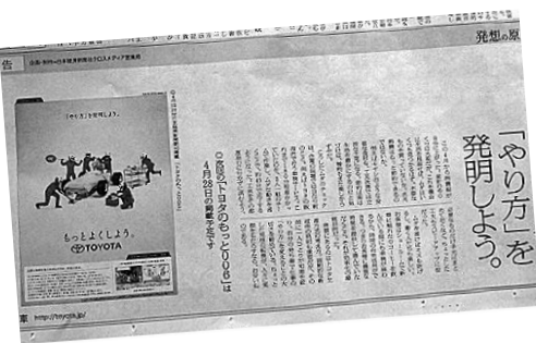
日経新聞に掲載されたトヨタ自動車の広告