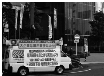
ミッドランド前の宣伝行動