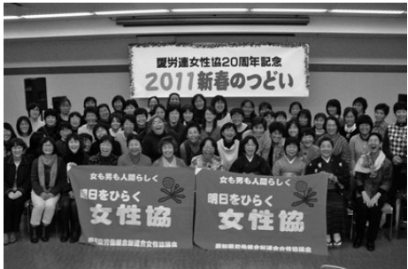
参加者みんな「ハイポーズ」

1月10日、女性協新春のつどいを開催し、90人以上が参加しました。今年のつどいは女性協発足20周年を記念して、過去のたまたかいを振り返るスライド上映や、記念の冊子を配布しました。