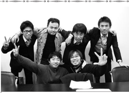
名古屋港管理組合 職員労働組合青年部

昨年9月に新庁舎へ移転したばかりの港職労青年部。彼らの仕事は、港の仕事をやりながら、クルーの維持管理、修繕工事の監督、水門開閉の電気管理、堀川の水門保守管理、臨港地区の行為規制など多岐にわたっています。