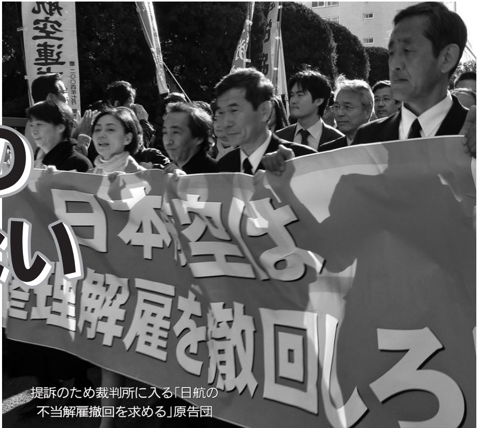
提訴のため裁判所に入る「日航の不当解雇撤回を求める」原告団

2010年12月31日、会社更生手続き中の日本航空(JAL)が機長、客室乗務員など165人に「整理解雇」を強行。1月19日には対象となった機長ら146人が解雇撤回を求め裁判提訴した。日本航空は希望退職者を募集し、会社の設定した目標数に達したにも関わらず、退職者を「0人」とカウントし、「人員削減目標に達しなかった」と、一定年齢以上のベテラン乗務員や病歴のあるものを対象に解雇を実施した。この問題では、「整理解雇4要件」を満たさない「国家による不当解雇」であると組織や団体の枠を超えた支援の輪が広がっている。2010年12月27日には全労連、全労協などの労働組合をはじめ、市民団体、弁護士らを中心に国民支援共闘会議が結成された。