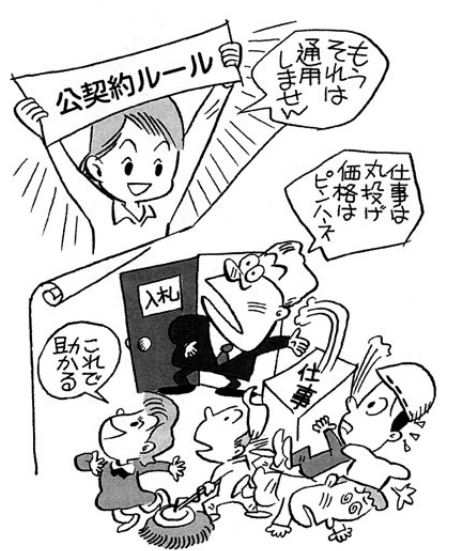
「公契約法の実現をめざす大阪懇談会」パンフより

埼玉県ふじみ野市のプール事故の場合、現場労働者は資格はありませんでした。静岡県浜名湖のボート