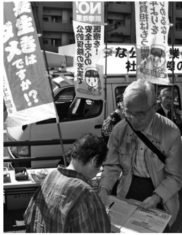
覚王山日泰寺で「後期高齢者医療制度廃止」を求める署名行動

さらに国保の運営を現行の市町村単位から都道府県に広域化することも狙われており、自治体からの一般財源投入をできなくし、歯止めのない国保料(税)引