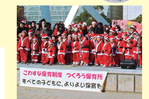
保育を守るクリスマスアピール＝2010年12月18日(白川公園)