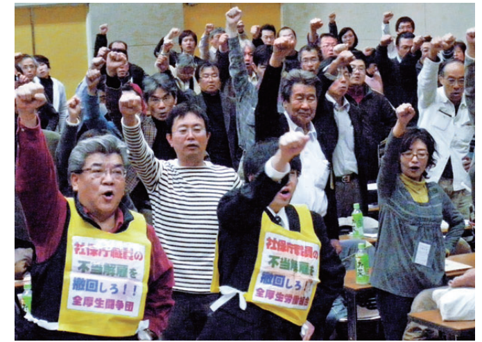
11春闘をともにたたかう決意で「団結ががんばろう」をする代議員のみなさん＝2010年12月19日

12月19日 浦郡労働福祉会館で開催した愛労連第44回臨時大会では、11春闘をすべての組織・組合員の参加でたたかいていく意思を国際的にみて日本だけが