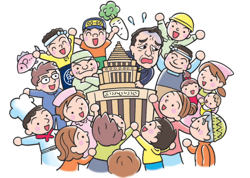
「子ども・子育て新システム」の制度案が2010年12月18日の通常国会で審議される予定です。