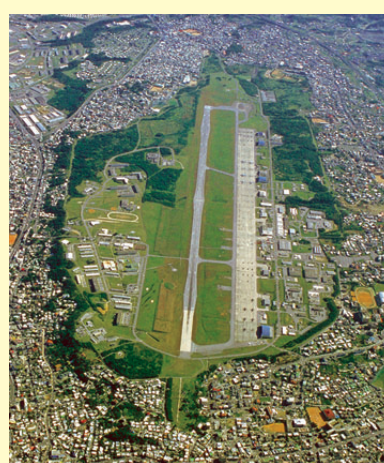
住宅街の真ん中に広がる普天間基地

昨年名護市長選挙と沖縄県知事選挙の応援に行きました。沖縄では大多数の県民の意向を無視して米軍再編計画のため、辺野古の新基地建設や東村高江のヘリパッド建設等が強行されようとしています。 これに強く反対し、沖縄の美ら海と豊かな自然を守ることは、生物多様性の面からも県民の平和な暮らしの面からも、とても大切だと考えます。いや、単に沖縄だけの問題ではなく、日本と世界の平和と未来に関わることだと思います。私は本年も粘り強く、基地のない沖縄を目指してがんばるつもりです。