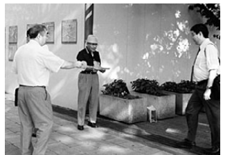
県庁前でピラをまく参加者

とき 10月13日(土)13:30~ 10月14日(日)10:00~ ところ 労働会館本館2F会議室 参加費 300円 弁当代 1,000円(2日目)