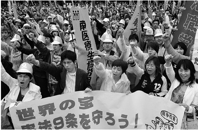
政治を変えようと昨年5月の国民大集会には愛知から619人が参加。

■とき 10月28日(日) 文化行事 11:00~11:50 国民大集会 12:00~13:30 ■ところ 東京・亀戸中央公園 ※集会終了後デモ行進