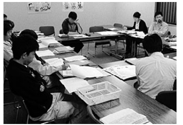
青年部役員や若手役員が講師を務める学習会