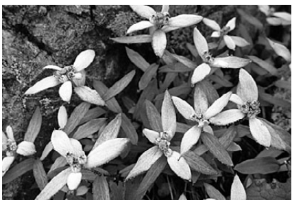
南アルプス仙丈岳稜線で撮影 文・写真 市場丈規 (あるきすとの会代表)

♪エーデルワイス、エーデルワイス。この曲と歌詞に魅せられて山に登る輩も多いのでは?和名は「薄雪草(ウスユキソウ)」、高嶺の岩肌にしがみつくように咲く様はその名のように儂げだ。この花を求めて、遠くは北海道礼文島まで足を伸ばしたことも。写真は南アルプス仙丈岳稜線で撮ったもの。朝露に濡れた姿は寒空に震える少女のようだ。数十種もの色とりどりの花で覆われた仙丈岳にあっても、その神秘的な美しさはひととき心を引きつける。ところで、私が薄雪草を撮るといつもピンボケ写真になってしまう。昔年の恋人にでも会ったように心(手)震えるのだろうか。