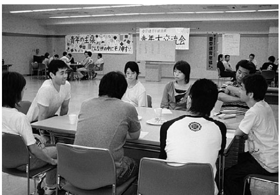
討論のコーナーで職場の実態を話しあう参加者

6月25日(日)青年協主催の「青年大交流会」では、労組以外に民青同盟・県学連の仲間を加えた41名の参加者が集まりました。 輪になった青年が「何でもバスケッ ト」や「絵しりとり」ゲームで汗をかき、罰ゲームで美味しい(?)青汁を飲んで大盛り上がり交流の後、グループに分かれての分散・討論会 参加者からは「職場以外に知り合いが少なく、色々な人と出会えて良かった」