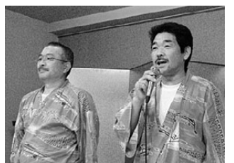
交流会で報告するスミケイの仲間

この1年間のたたかいを通して、特別報告がこなわれ、①勝利和解した東日本鉄工のたたかい、②再審開始決定を勝ちとった布川事件、③6月29日に判決を迎える国公法弾圧掘越事件のお礼と決意が述べられました。 記念講演は、「国際人権水準から見た日本の裁判」で、自由法曹団国際 この集会には、愛知から