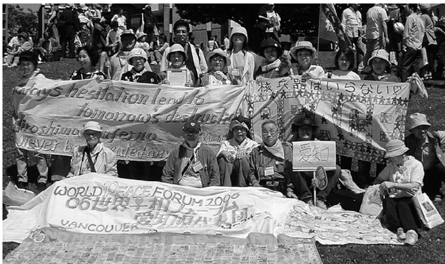
バンクーバーでの反戦パレードを終えて集まった愛知からの代表団