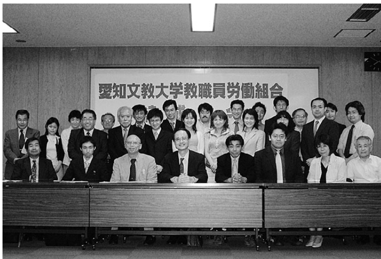
結成大会に集まった愛知文教大学教職員労働組合の仲間たち