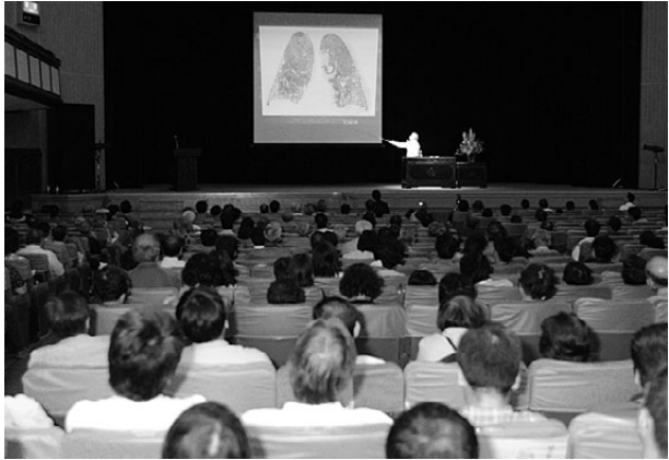
海老原先生の講演を聴く参加者

6月18日、名古屋市公会堂で、「なくせ、じん肺・アスベスト」愛知県民集会が、約500名の参加で開催されました。7月7日の東京地裁「判決」(※原告勝訴)を直前に控えた市民集会となったこの集会には、建交労働組合員、愛労連など多くの労働組合関係者、医療団体や患者組織、行政関係者などが集まりました。