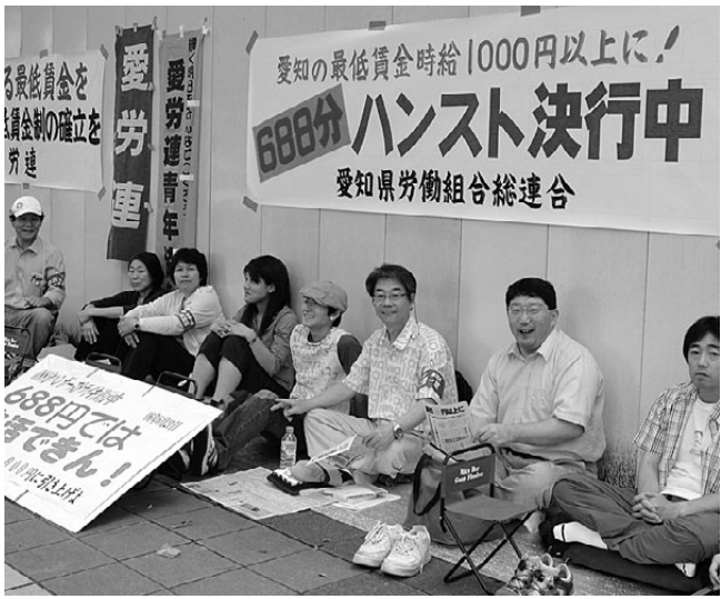
ハンストに参加した仲間たち

最低賃金は、7月末に中央最低賃金審議会が目安をだし、これを受けて愛知最低賃金審議会が愛知の最低賃金引き上げについて審議し8月初旬の審議会で答申予定です。 愛労連は6月21日、労働局前で時給1000円以上の最賃をめざし、688分のハンガーストライキを実施。通して10人、激励者などを含め45人が参加しました。連合独占の審議会のもとで、少なくとも現場労働者や最賃生活体験者による「意見陳述」を求めました。全労連の調査によると、「意見陳述」は6月28日に決定した奈良を含め、これまで10府県で実施や計画がされています。7月3日には、愛労連最賃対策委員のメンバーが労働局賃金課にあらためて意見陳述の実現を強く要請。担当者も「現行最賃は低いと認識はしているが、審議会にとやかく言えない」と回答しました。今後7月18日に、三の丸での宣伝、7月27日の審議会にむけた宣伝をはじめ、現在でとりくんでいる署名(個人・団体)を集約し、7月26日までに提出することになっています。