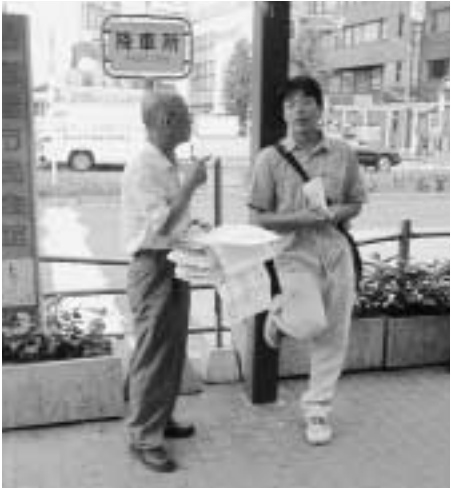
営業所廃止反対を訴える 通産労の仲間(9月2日金山総合駅)