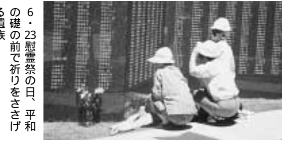
6・23慰霊祭の日、平和の礎の前で祈りをささげる遺族