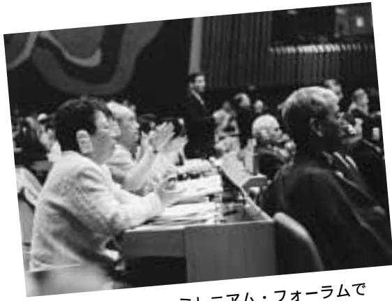
ミレニアム・フォーラムで

「平和・軍縮・安全」の分科会に参加した日本代表団は、「被爆の実相や、核兵器の緊急廃絶の重要性や