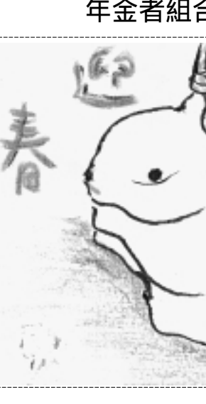
年金者組合 婦人部南支部