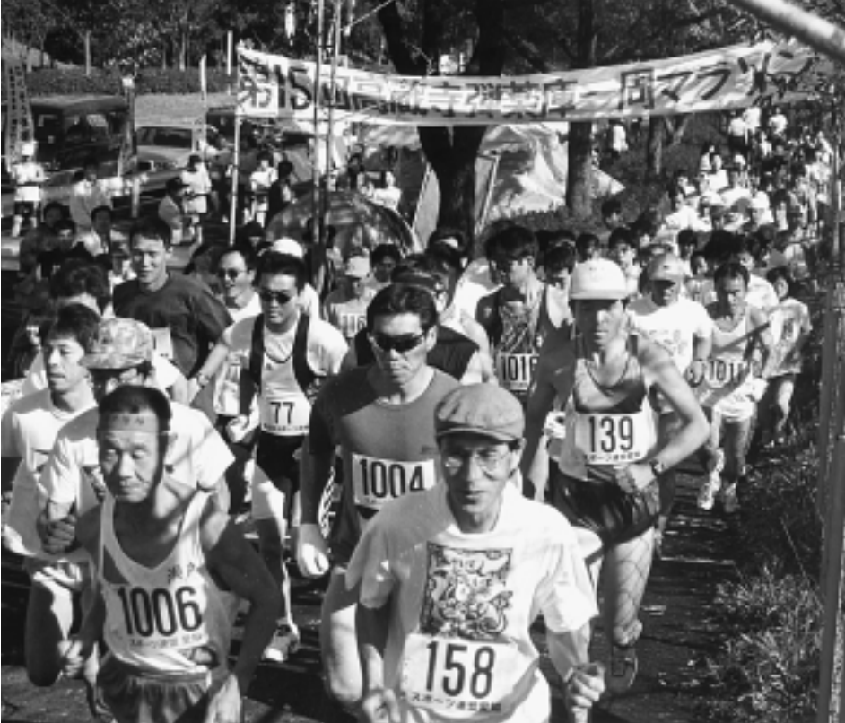
平和にむけてスタート('98.12月高蔵寺マラソン)