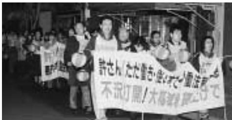
小さな駅でも宣伝行動 (海部・津島労連)