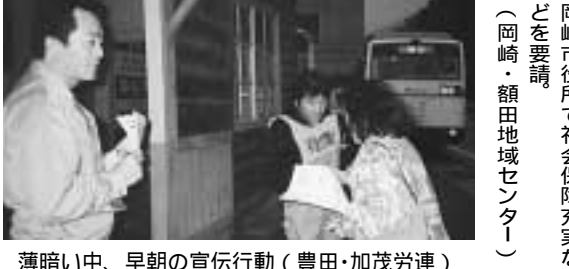
薄暗い中、早朝の宣伝行動(豊田・加茂労連)

運動の高まりを肌で感じた!! 一月一日の地域労連交流集会で2・26総行動の構えや他の地域労連の取り組みを聞いて、本気でやらないかんと思ひ直しました。その後の単組代表者会議で、年金者組合や愛高教から積極的な発言があり、今までにない運動にしようという機運が生まれました。愛高教からは、「半田市職ができない駅は愛高教の分会が受け持つ」と決意があり、早朝宣伝は最初は五駅の予定でしたが十九駅まで増やすことができました。昼間は、社保の街頭署名