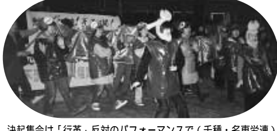
決起集会は「行革」反対のパフォーマンスで(千種・名東労連)