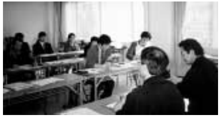
労働基準監督署に労働法制改悪反対で申し入れ (一宮地区労連)