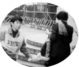
駅頭宣伝には名鉄・瀬戸線の運転手も協力 (守山労連)