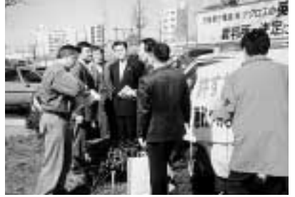
「不当解雇は許さない!」アクトス前での抗議行動 (尾東労連)