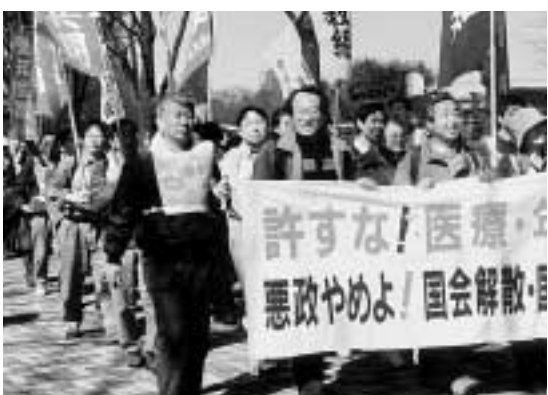
「もう黙つとれん、くらし・職場を変えよう」と。2・26のあの大集會に三・八大集會につながる愛知からの参加者は、九百十八名にも膨れ上がった。

と、今に八チがあたるでよー!!」と訴えた。集會では、「2・26列島騒然総行動には全国津々浦々から、百万人が参加した。今日の集會を力に4・17全国統一行動、メーデーに向け、職場と地域で力を合わせて要求実現のために奮闘しよう」と決議した。デモは四コースに分かれて、沿道の買い物客たちにアピールした。