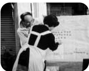
スーパー前で「消費税」のシール投票。圧倒的多数が3%にもとせ!! (天白地域センター)