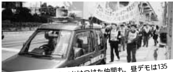
区役所から自転車でかけた仲間も。昼デモは135名の参加(瑞穂区労連)

などへの要請行動、労組訪問、スパー前での宣伝行動、夜は、決起集会・提灯デモが二十三地域でおこなわれ、一日の行動参加者は延べ一万人となり、愛労連結成以来の大きな運動となりました。参加した組合員が励まされ、運動に確信が持てた取り組みとなりました。