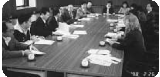
岡崎市役所で社会保障充実などを要請(岡崎・額田地域センター)