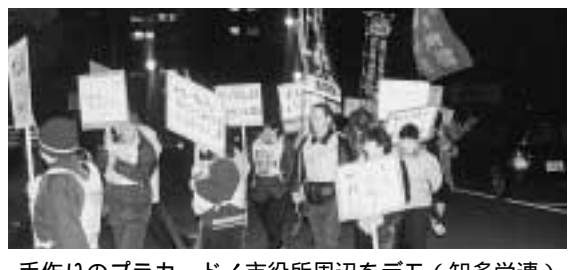
手作りのプラカード!市役所周辺をデモ(知多労連)

を名鉄太田川と知田半田の駅前で行いました。太田川では、百五十人分の署名が集まり、夜の決起集会でもその様子を愛高教の支部長さんが、生き生きと発言してくれました。風が強く提灯デモはできませんでしたが、組合員の手作りのプラカードを持って、市役所の周辺を元気に歩きました。女性部隊が中心になって炊き出しもしました。知多の厚生病院からも、参加するとの電話もあり、運動の高まりが肌で感じられました。