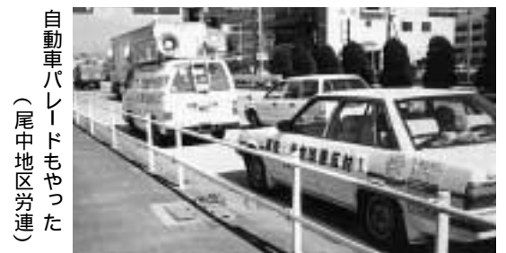
自動車パレードもやった (尾中地区労連)