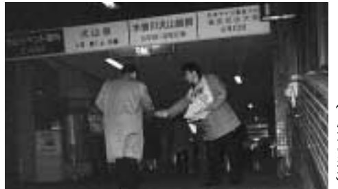
名鉄犬山駅で早朝宣伝 (尾北労連)