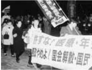
八駅すべてで宣伝行動 (名西労連)