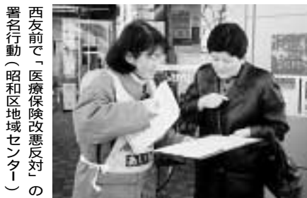
西友前で「医療保険改悪反対」の署名行動 (昭和区地域センター)