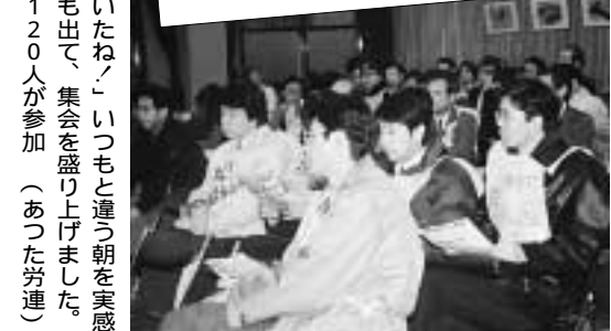
「バス停でもピラをまいていたね!」いつもと違う朝を実感した組合員の声。ニュースも出て、集会を盛り上げました。決起集会・提灯デモには、1200人が参加(あつた労連)